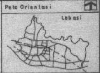
Peta Situasi Skala 1:20000