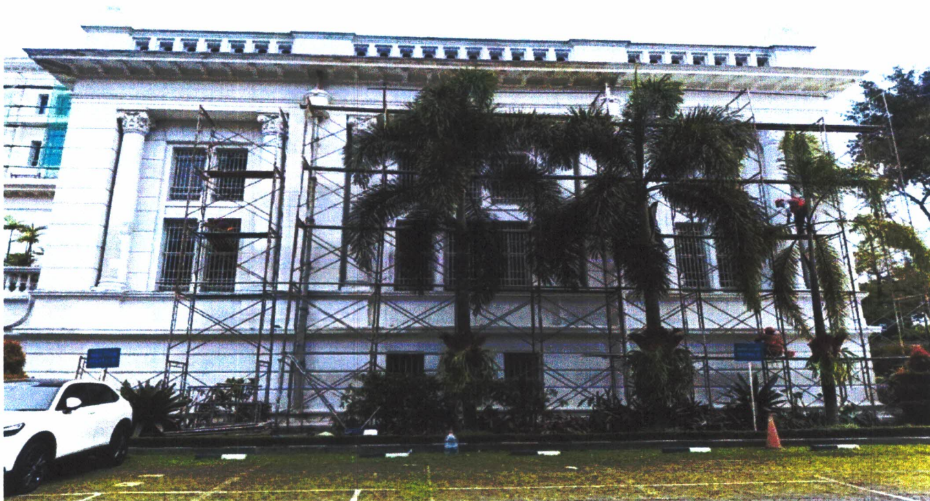
Gambar 06. Sisi utara De Javasche Bank yang sedang dilakukan perawatan .