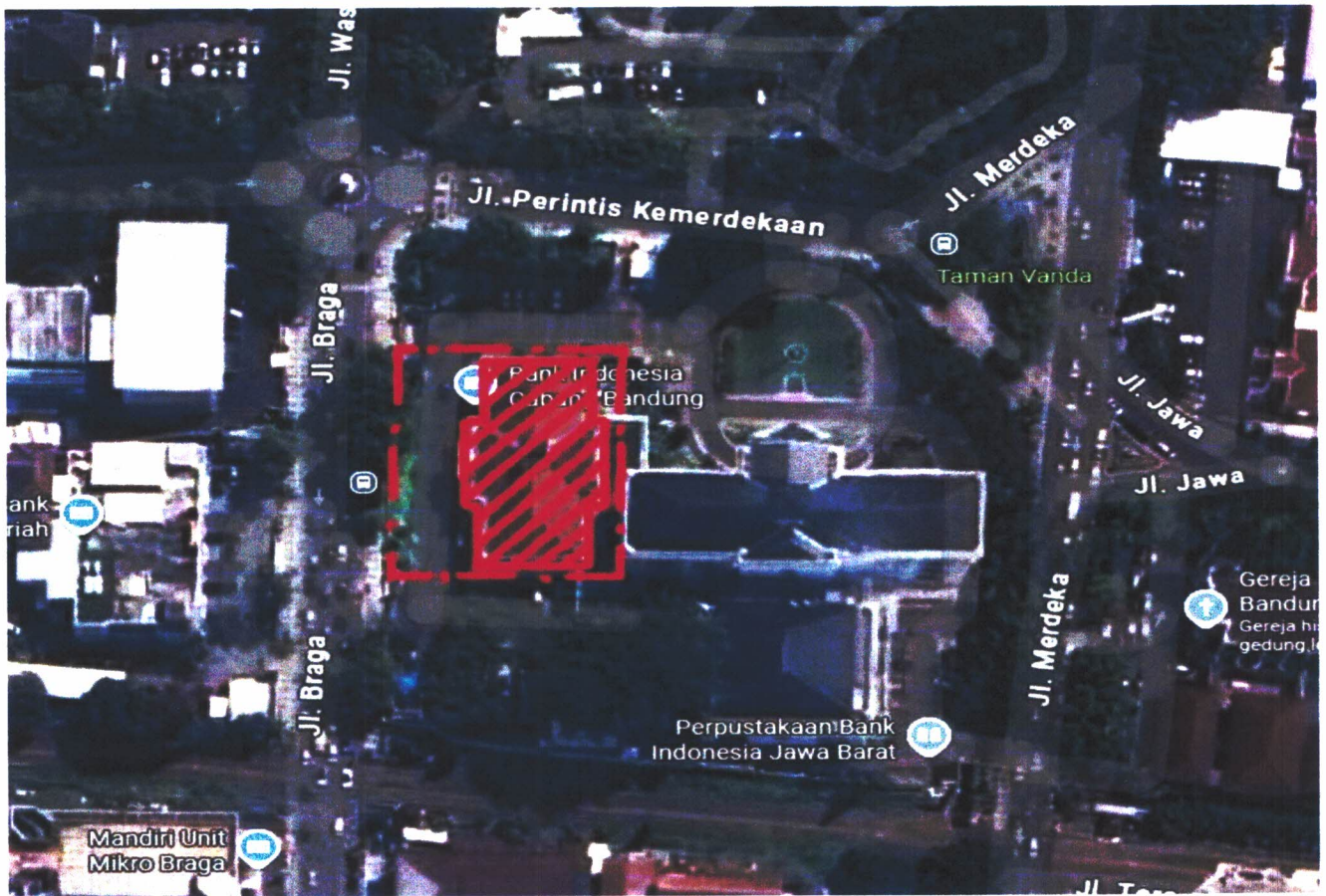
Gambar 02. Citra satelit lokasi Gedung De Javasche Bank