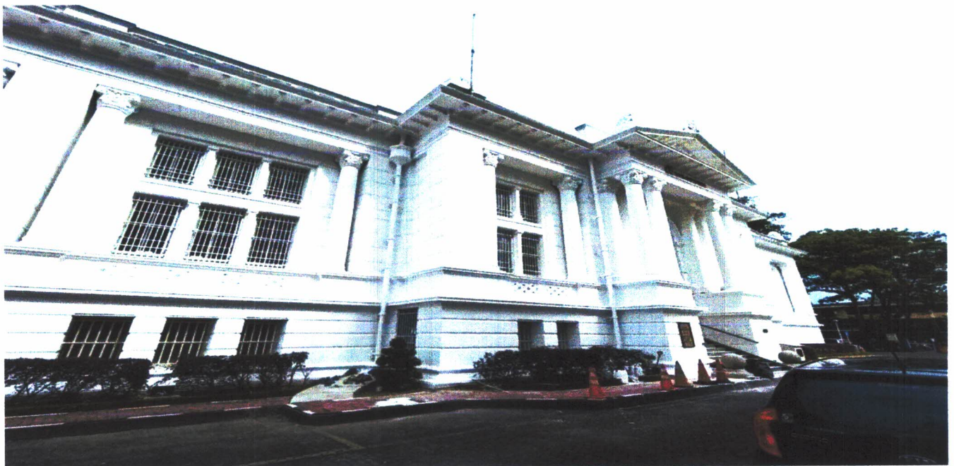
Gambar 01. Foto fasad depan Gedung De Javasche Bank