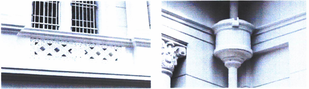
Gambar 08. Ornamen-ornamen yang berada pada bagian eksterior bangunan