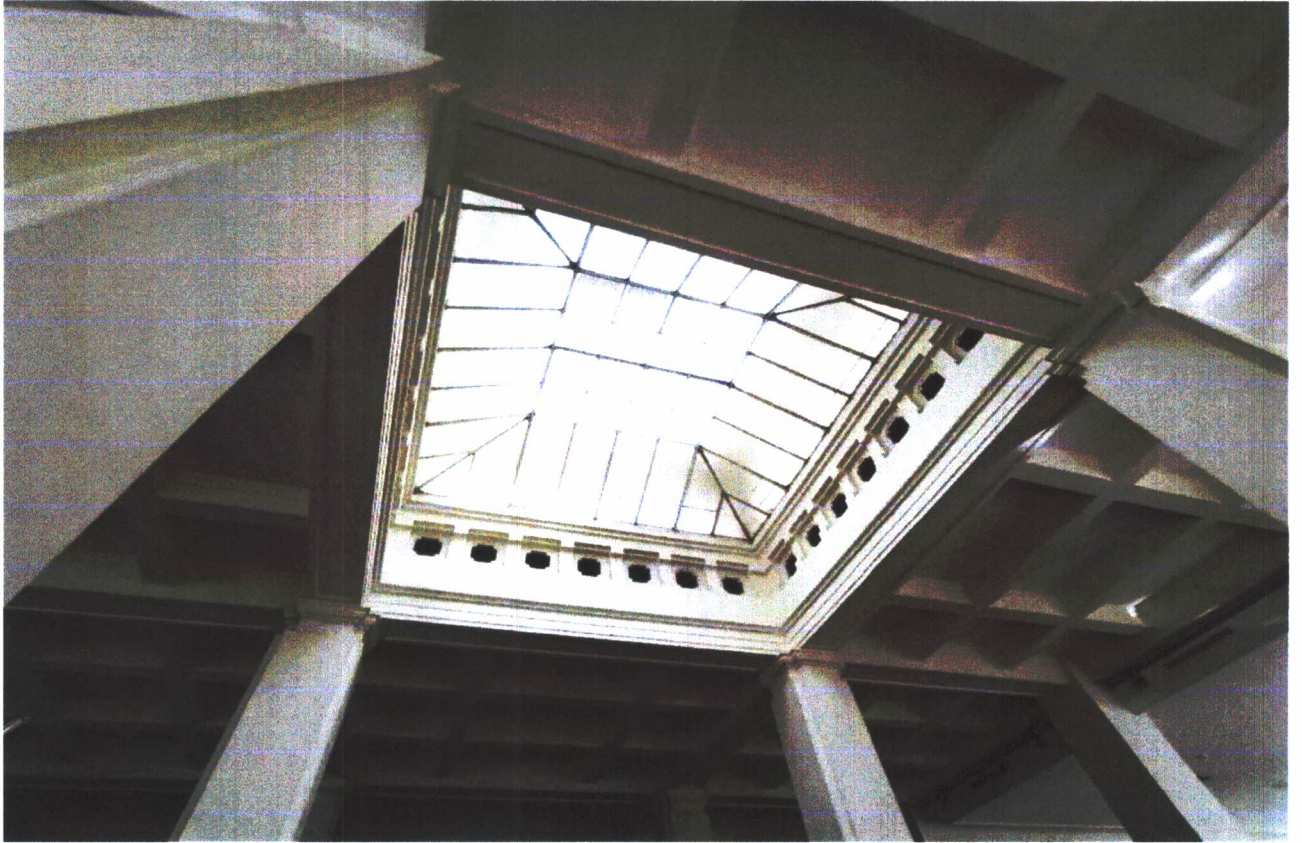
Gambar 07. Bagian skylight pada interior bangunan