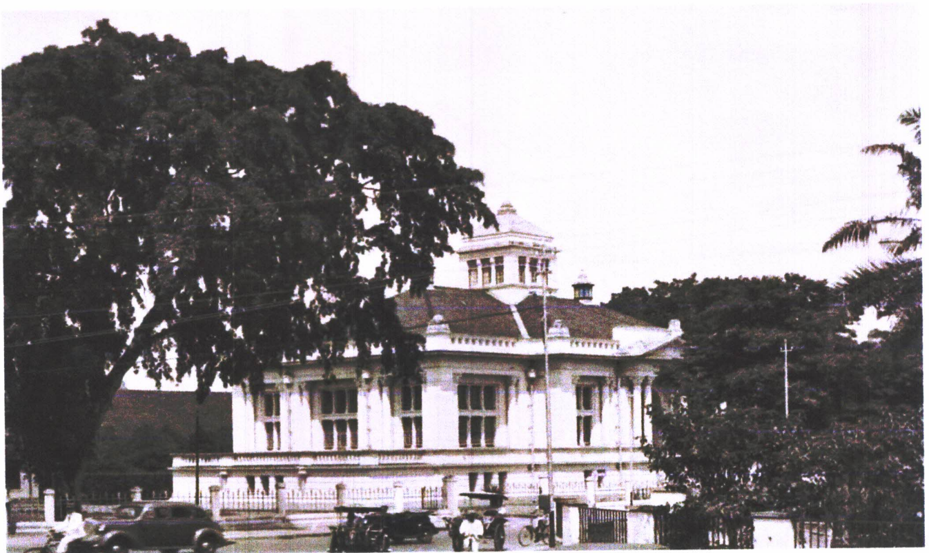
Gambar 04. Foto De Javasche Bank, sekitar tahun 1938.