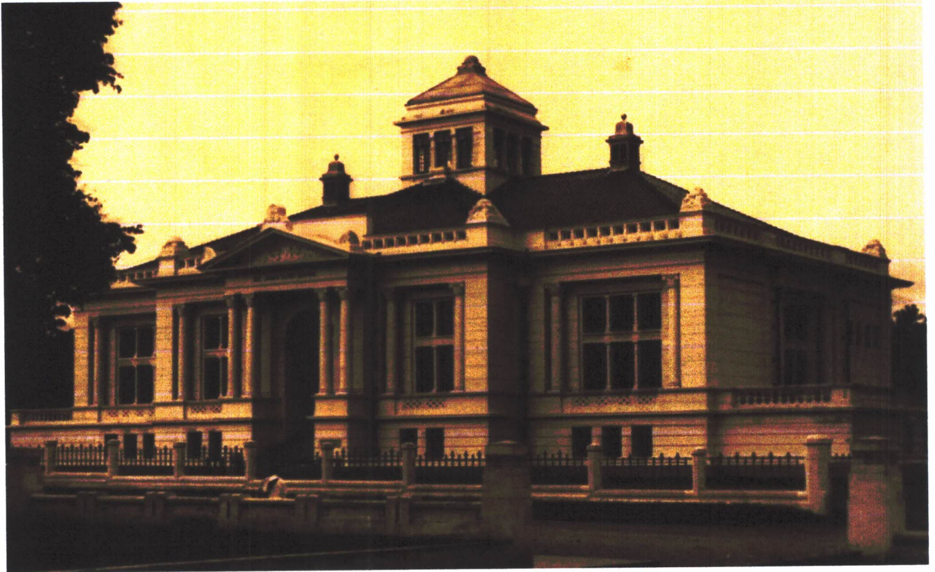
Gambar 03. Foto De Javasche Bank, sekitar tahun 1933.