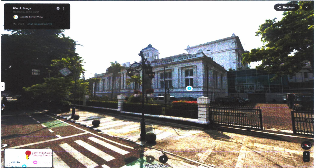
Gambar 05. Kondisi tahun 2024 De Javasche Bank