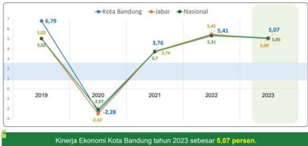
Grafik 1.1 Laju Pertumbuhan Ekonomi (LPE) Kota Bandung Tahun 2019–2023 dan Perbandingannya dengan Jawa Barat dan Nasional

Berita Resmi Statistik Kota Bandung- 28 Februari 2024