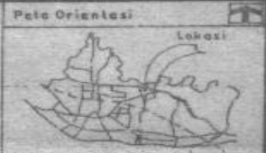
Peta Situasi Skala 1:10000